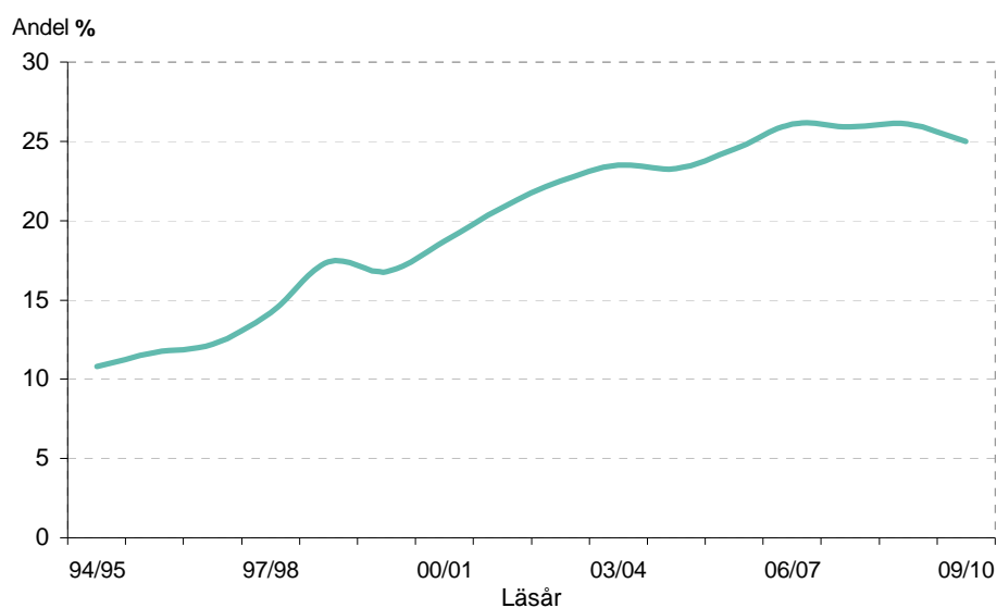
Diagram 2: Andel (%) lärare (heltidstjänster) i gymnasieskolan som saknar pedagogisk högskoleexamen 1994/95–2009/10

Andelen av gymnasielärarna som saknar pedagogisk högskoleexamen har ökat under flera år. Mellan läsåret 1994/95 och 2009/10 ökade andelen från 13,8 till 27 procent. Omräknat till heltidstjänster så blir andelen lärare utan pedagogisk högskoleexamen 25 procent läsåret 2009/10 jämfört med 10,8 procent läsåret 1994/95. Andel lärare som saknar pedagogisk högskoleexamen (heltidstjänster) redovisas i diagram 2.